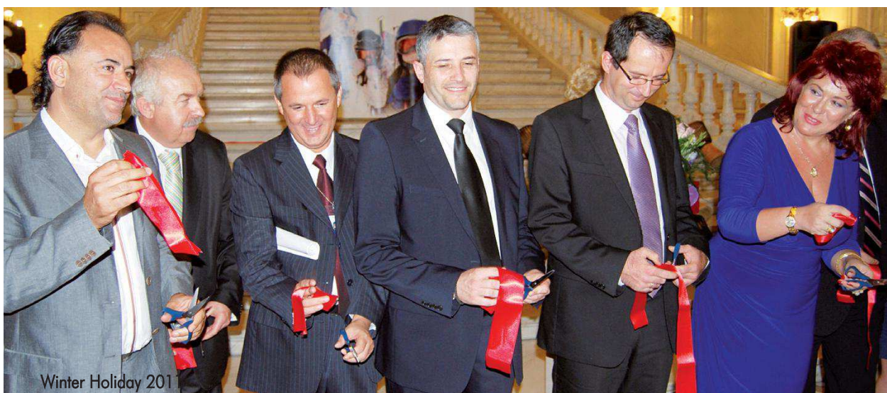
Winter Holiday 2011

- La un moment dat, într-un simpozion care s-a ținut pe litoral, în care se cerea imperativ, pe mai multe voci, desființarea tarabelor și tarabagiilor, am surprins probabil asistența cu punctul meu de vedere. Spuneam atunci că această tarabă este primul pas pentru omul acela pe tărâmul afac-