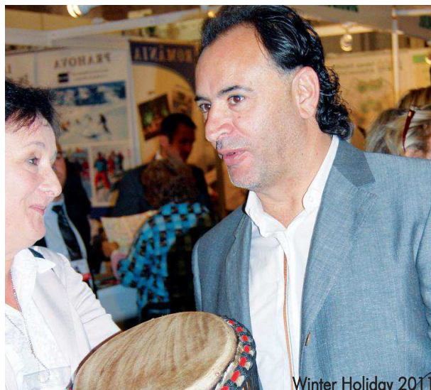
Winter Holiday 2011